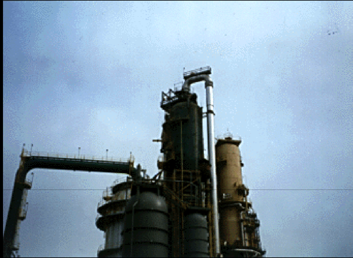
Reactor de lecho fluidizado British Petroleum