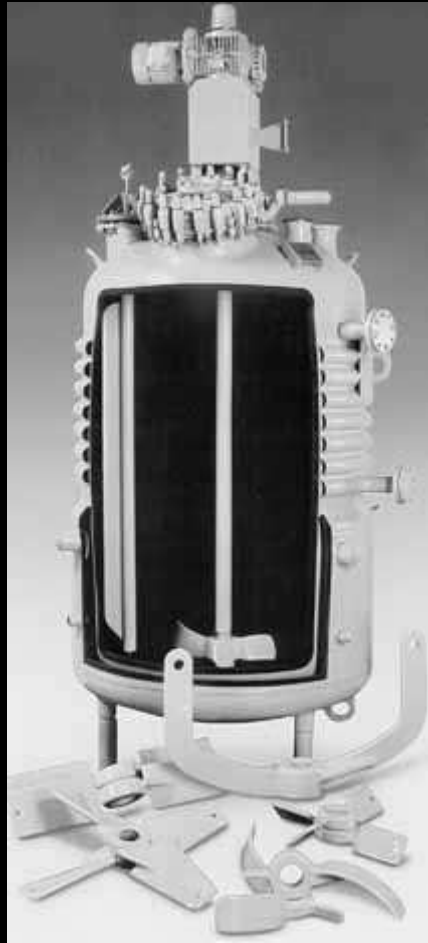
Reactor Agitado Permanente (CSTR o RAP)