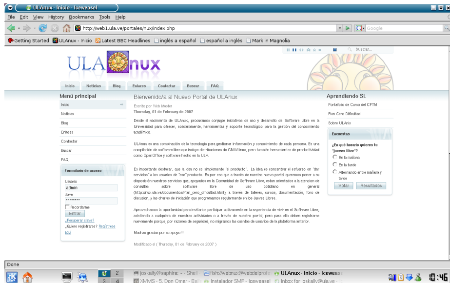
Fig. 3. Un portal para usuarios de ULAnux

atención y el esfuerzo de nuestro personal técnico sobre un conjunto (abierto) pero bien seleccionado de aplicaciones, podremos atender más efectiva y eficientemente a nuestros usuarios.