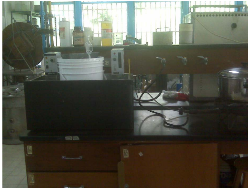
Medición de Grados Brix y Densidad